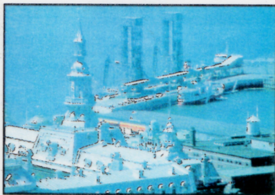
PORT DE QUÉBEC

Remorqueurs : bateau conçu pour déplacer, d'un point à un autre, d'autres bateaux dans un port, sur un fleuve ou en mer.